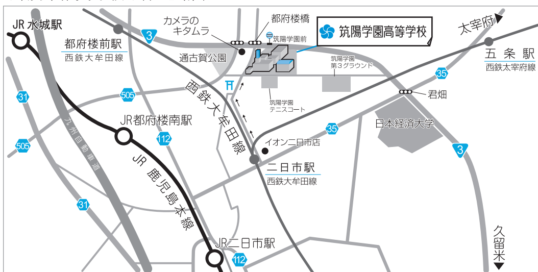
筑陽学園高等学校 所在地略図